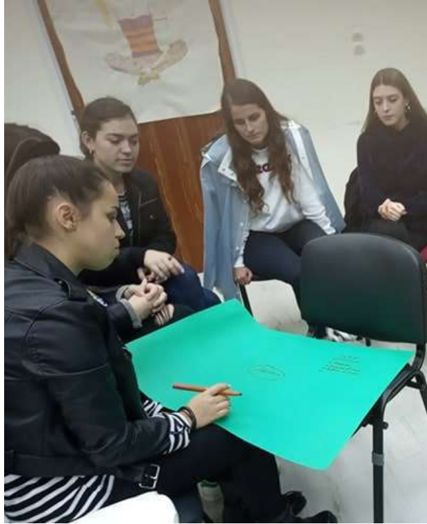
2 η Υποομάδα